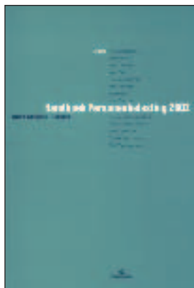
Handboek personenbelasting 2002 Ludo DILLEN en Luc MAES (ed). Ced Samsom, 2002, 1738 p.

Alle facetten van de personenbelasting komen aan bod, met uitvoerige verwijzingen naar rechtspraak, rechtsleer en administratieve commentaren. De eerste drie titels zijn inleidend, ze behandelen onder meer de algemene kenmerken van de personenbelasting, de ratione personae , en het aangifteformulier van het besproken aanslagjaar.