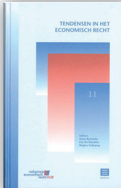
Tendensen in het economisch recht (11) / K. Bytbeier, E. De Batselier en R. Feltkamp (Ed.) Maklu, 2006, 399 p.

De Vakgroep Economisch Recht van de VUB organiseerde drie studiemiddagen, waarvan een referatenbundel werd gepubliceerd: