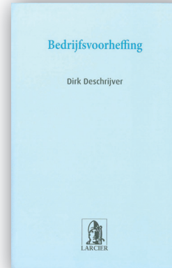
Bedrijfsvoorheffing / D. Deschrijver Larcier, 2006, 456 p.

Prix : 37,60 EUR Commander : Patrimoine, Rue du Noyer 168, 1030 Bruxelles Tél. 02 736 68 47