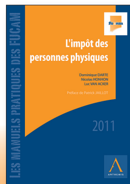
Édition 2011 – 660 pages – 65 €