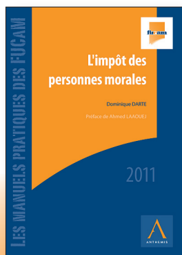
Édition 2011 – 150 pages – 57 €

La solution est la même que celle qui a déjà été appliquée pour des demandes visant à exercer un mandat en lien avec l'activité exercée dans le cadre du contrat de travail : le professionnel peut obtenir l'autorisation du Conseil pour accepter une telle fonction lorsqu'elle s'inscrit dans l'exécution du contrat de travail. ●