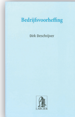
Bedrijfsvoorheffing / D. Deschrijver Larcier, 2006, 456 p.

Prix : 37,60 EUR Commander : Patrimoine, Rue du Noyer 168, 1030 Bruxelles Tél. 02 736 68 47