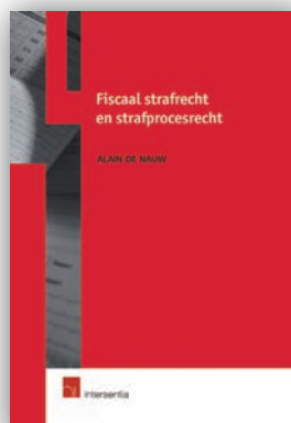
Fiscaal strafrecht en strafprocesrecht / A. De Nauw Intersentia, 2007, 137 p.

In dit handige boek schetst de auteur het volledige fiscaal strafrecht op een minuttieuze en praktijkgerichte wijze. Met oog voor detail en rekening houdend met alle recente wetwijzigingen en evoluties in de rechtspraak komen alle aspecten van het materiële fiscaal strafrecht en de procedure aan bod.