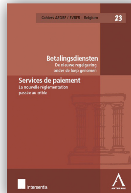
Les services de paiement – De betalingsdiensten. La nouvelle réglementation passée au crible – De nieuwe wetgeving onder de loep genomen / B. Feron (ed.) Intersentia / Anthemis, 2011, 200 p. (Cahiers AEDBF/EVBFR; 23)

Prijs: €150,00 (20% korting voor abonnees op deze reeks) Bestellen: www.trv.be of biblo@biblo.be Tel. 078 35 33 08