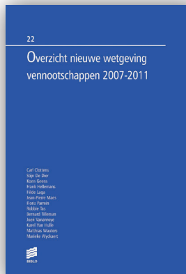
Overzicht nieuwe wetgeving vennootschappen 2007-2011 / Jan Ronse Instituut (ed.) Biblo, 2011, 285 p. (Reeks Rechtspersonen- en Vennootschapsrecht; 22)

Prix: €90,00 Commander: www.bruylant.be Tél. 0800 99 613